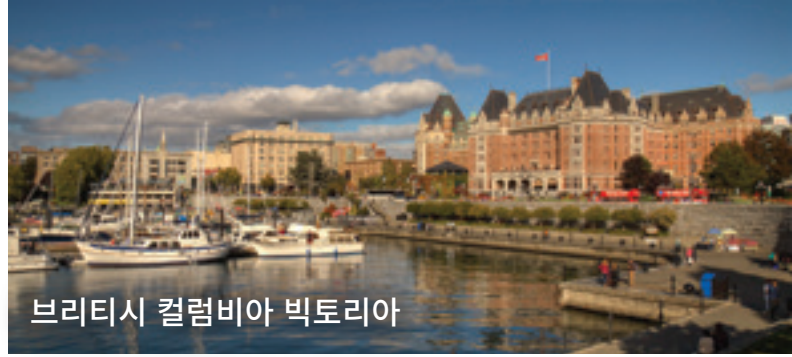
브리티시 컬럼비아 빅토리아