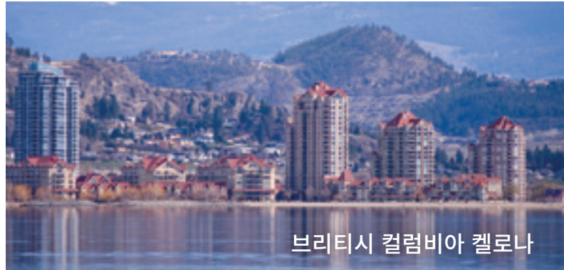
브리티시 컬럼비아 켈로나